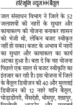
हरिभूमि न्यूज ॥ बैतूल

जल संसाधन विभाग ने जिले के 52 जलाशयों की नहरों के सुधार और कायाकल्प की योजना बनाकर शासन को भेजी थी, लेकिन बजट स्वीकृत नहीं हो सका। बजट के अभाव में नहरों का सुधार और कायाकल्प का कार्य अटका हुआ है। बता दें कि यह योजना पिछले एक साल से बजट स्वीकृति का इंतजार कर रही है। इस योजना में जिले के बैतूल डिवीजन की 40 और मुलताई डिवीजन की 12 नहरे यानि बैतूल, घोड़ाडोंगरी, भैंसदेही, भीमपुर, शाहपुर, चिचोली, आठनेर और मुलताई विकासखंड के कुल 52 जलाशयों की नहरों को शामिल किया गया है। इन जलाशयों की नहरें लंबे समय से जर्जर अवस्था में हैं। कई जगह नहरों की दीवारें टूट चुकी हैं और पानी का रिसाव लगातार हो रहा है। अब तक विभाग को नहरों की मरम्मत के लिए बहुत सीमित बजट मिलता था, जिससे केवल नहरों की सफाई जैसे सामान्य कार्य ही होते पाते थे। नहरों की संरचनात्मक मरम्मत नहीं होने के कारण खरी सीजन में जब पानी छोड़ा जाता है तो काफी मात्रा में पानी रास्ते में ही बर्बाद हो जाता है और अंतिम छोर तक पर्याप्त पानी नहीं पहुंच पाता। जिससे किसान फसलों को पर्याप्त पानी नहीं दे पाते और परिणाम स्वरूप उत्पादन कम होता है।