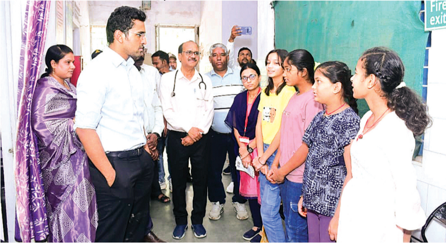
हरिभूमि न्यूज ▶▶ हरदा